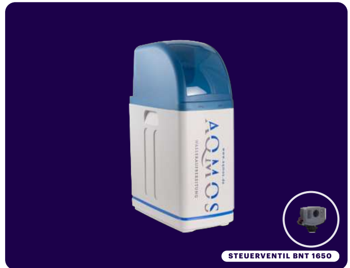
STEUERVENTIL BNT 1650